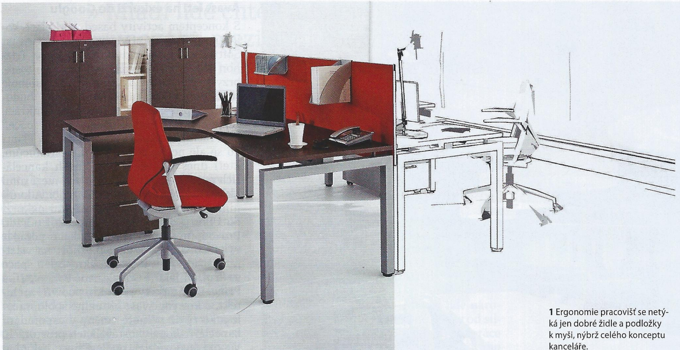
1 Ergonomie pracovišť se netýká jen dobré židle a podložky k myši, nýbrž celého konceptu kanceláře.